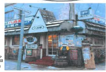
※網走に宿泊したら、ここで飲み食べもいいかも! です。網走のお好み焼きもおいしいよ。(日中の営業はしていません、夕方からです。)