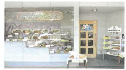
※地元の子や営業マン、もちろんファミリーにも人気店です

『 五寸釘の寅吉 』、『 脱獄王 』、『 岬を駆ける女 』、『 馬喰一代 』、『 塩狩峠 』、『 君の名は 』、『 ひかりごけ 』君はいつ知ってるかなあ?